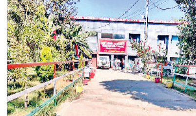
महेन्द्रगढ़। राजकीय मॉडल संस्कृति स्कूल का मुख्यद्वार।

संबद्धता मिल चुकी है, जबकि शेष की प्रक्रिया जारी है। इसके अलावा, राज्य के विभिन्न कस्बों और शहरों में 1420 मॉडल संस्कृति प्राथमिक विद्यालय संचालित हैं। इसी कड़ी में महेन्द्रगढ़ की बात निःशुल्क तो यहां नौ मॉडल संस्कृति स्कूलों में भी दाखिला प्रक्रिया शुरू हो चुकी है। इन स्कूलों का मुख्य उद्देश्य अंग्रेजी माध्यम से