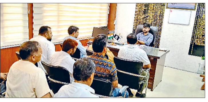
महेन्द्रगढ़। संचालकों के साथ बैठक करते एसडीएम।

उन्होंने कहा कि स्कूल स्तर पर जागरूकता रैलियां, पेंटिंग प्रतियोगिताएं, स्लोगन लेखन, संगोष्ठियां, विज्व, डिबेट एवं अन्य गतिविधियां आयोजित की जाएं। इन कार्यक्रमों के माध्यम से विद्यार्थियों को जागरूक किया जाए, ताकि वे यह संदेश अपने अभिभावकों एवं समाज तक भी पहुंचा सकें और जनगणना कार्य को सफल बनाया जा सके। इस जनगणना जागरूकता