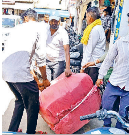
महेन्द्रगढ़। बरामदे से सामान उठाते कर्मचारी व रोड पर रखे कांटर को खींचते कर्मचारी।