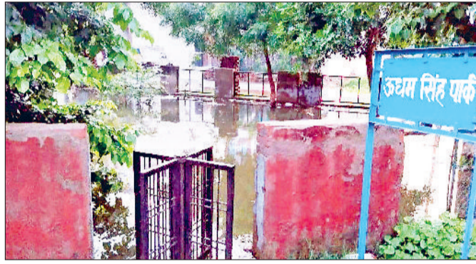
नारनौल। उधमसिंह पार्क, जिसमें जलभराव होने से बचा डूबा। (फाइल फोटो)

■ नूनी गांव मोड़ से कृष्णावती नदी तक डाली जाएगी 1.5 किमी लंबी पाइपलाइन, वर्षों की मांग के बाद जमा विभाग, 180 दिन में पूरा होगा प्रोजेक्ट