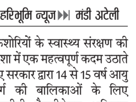
प्राथमिक हेल्थ सेंटर सिहमा।

किशोरियों के स्वास्थ्य संरक्षण की दिशा में एक महत्वपूर्ण कदम उठाते हुए सरकार द्वारा 14 से 15 वर्ष आयु वर्ग की बालिकाओं के लिए एचपीवी वैक्सिनेशन अभियान पुनः शुरू किया गया है। यह विशेष अभियान आगामी तीन महीनों तक चलेंगा, जिसका उद्देश्य किशोरियों को सर्वाइकल कैंसर जैसी गंभीर बीमारी से सुरक्षित करना है। स्वास्थ्य विभाग द्वारा इस अभियान को स्कूलों और नजदीकी स्वास्थ्य