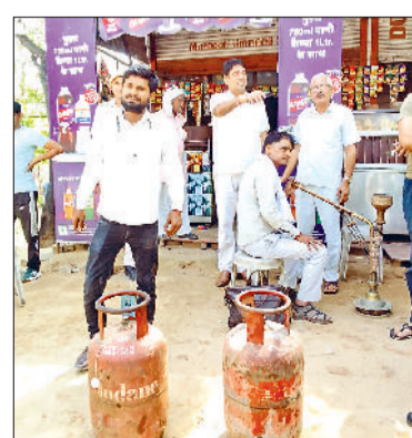
कनीना। कनीना में छापेमारी कर सिलेंडर काबू करते खाद्य एवं पूर्ति विभाग के अधिकारी।