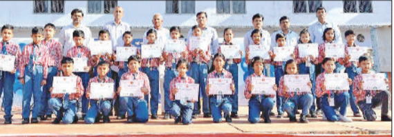
महेन्द्रगढ़। विजेता विद्यार्थियों को गोल्ड मेडल देकर सम्मानित करते हुए।